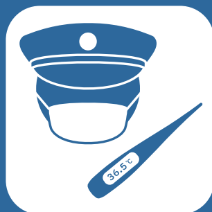
マスク着用・健康管理

常に外気を取り入れるため、路線バスにおいては窓を開けて運行しています。また高速バスにおいては「外気導入」に設定し、空気の入れ替えを行っています。