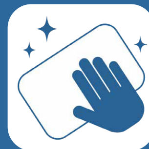
定期的な清掃・消毒